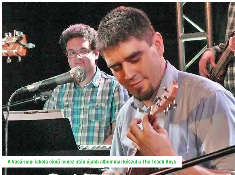
A Vasárnapi iskola című lemez után újabb albummal készül a The Teach Boys

A Szent István Gimnáziumban néhány éve megalakult tanári zenekar, a The Teach Boys alapjai a karácsonyi közös gitározásokhoz, a tanáriban nőnap alkalmából előadott dalokhoz, illetve a tiszapüspöki táborúezésekhez köthetők. A 2012-es szülői alapítványi bálon is felléptek néhány számmal a zenélni tudó pedagógusok, és az első koncert sikerén felbuzdulva a folytatás mellett döntöttek. Ettől kezdve The Teach Boys néven játszanak a diákok előtt.