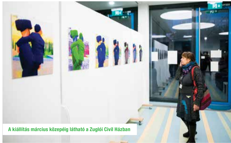
A kiállítás március közepéig látható a Zuglói Civil Házban