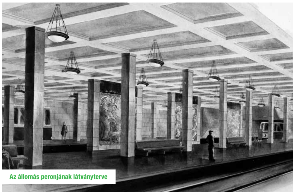
Az állomás peronjának látványterve

– Tízéves voltam, amikor a metrót elkezdtek építeni. A Hungárián laktunk, sokszor elmentem az építkezés előtt. Csak drótkerítéssel volt bekerítve, így be lehetett látni. Hatalmas gödröt ástak az állomásnak.