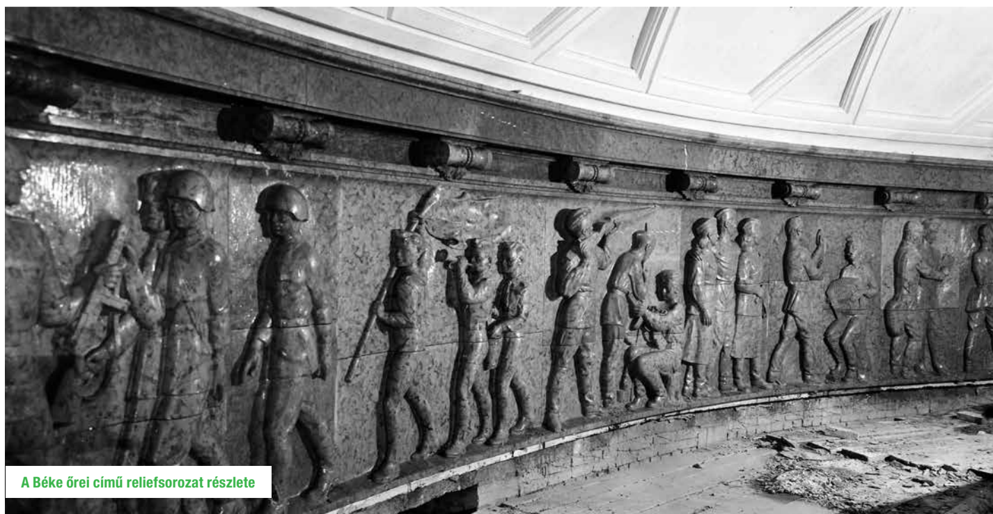
A Béke őrei című reliefsorozat részlete