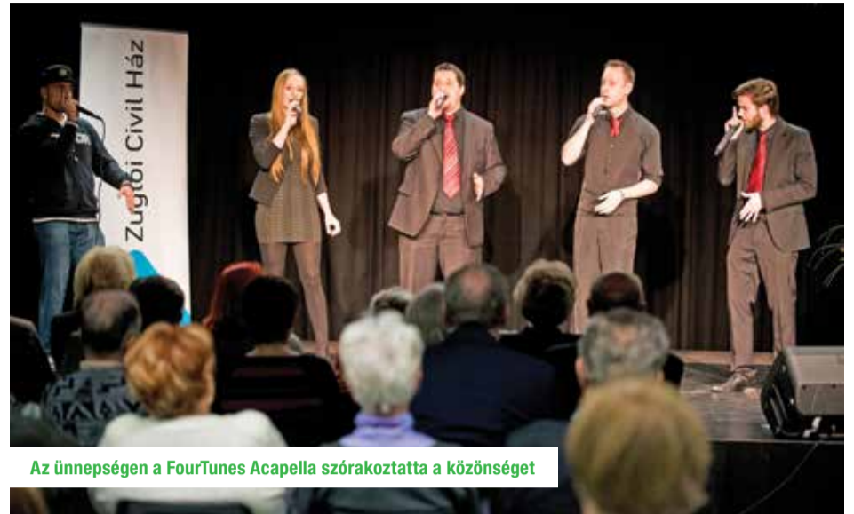
Az ünnepségen a FourTunes Acapella szórakoztatta a közönséget