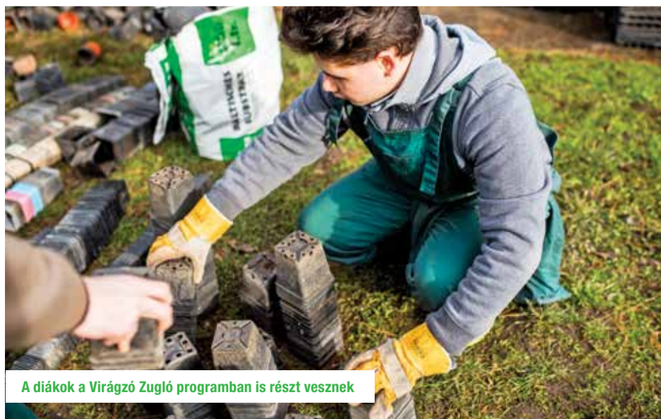
A diákok a Virágzó Zugló programban is részt vesznek

következnek a hagyományos programok: a Tavasz virágnap (április 16–17-én), a Múzeumok Éjszakája és a Kulturális Örökség Napjai. Mindhárom a 90. évforduló jegyében szervezik meg. Az év fő rendezvénye a Varga Márton-gálaest lesz novemberben. Az iskolában kialakítanak egy Varga Márton-émlékmúzeumot, és Négy évszak a japánkertben címmel dokumentumfilm is készül arra az alkalomra. R.T.