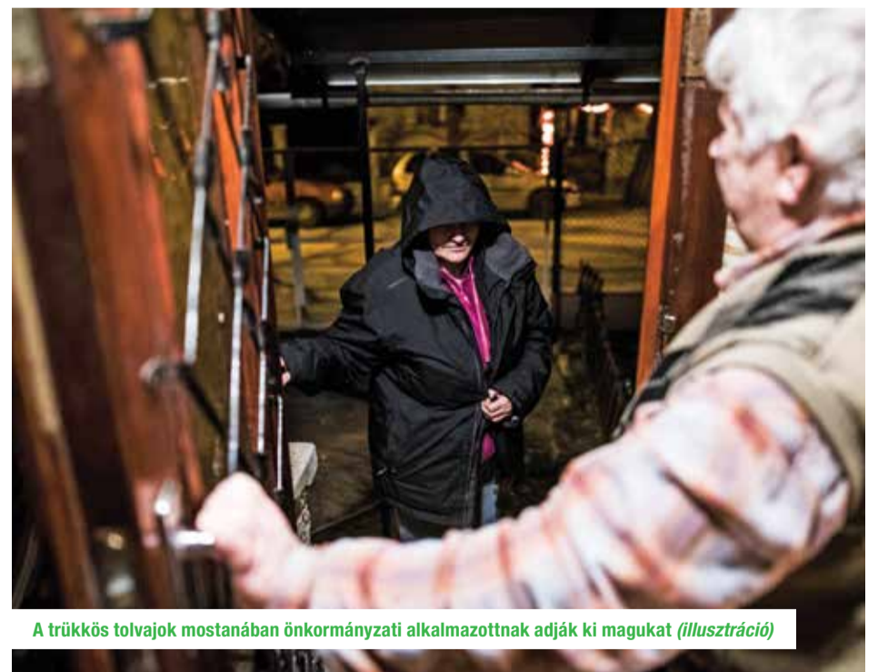
A trükkös tolvajok mostanában önkormányzati alkalmazottnak adják ki magukat (illusztráció)