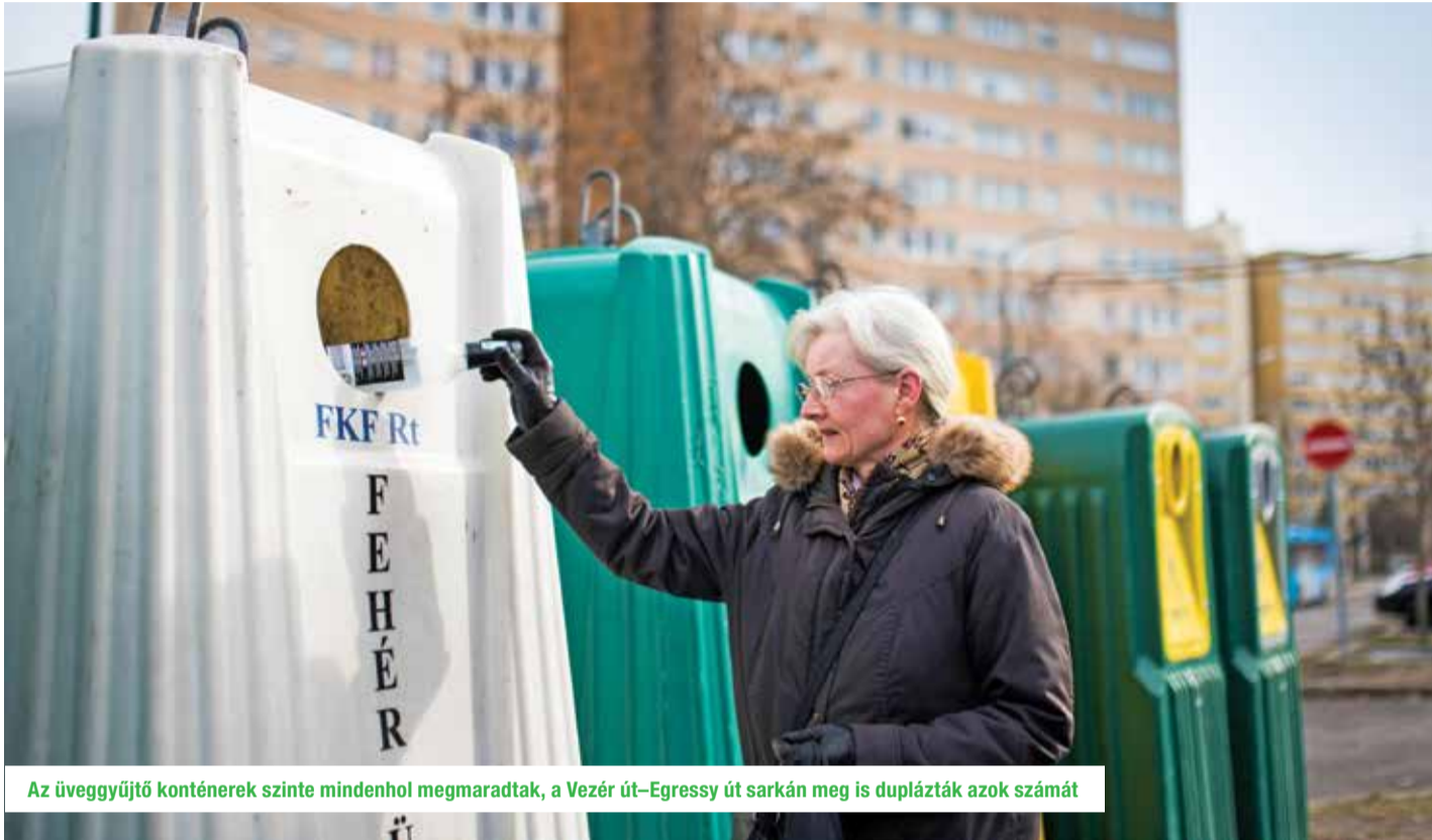
Az üvegyűjtő konténerek szinte mindenhol megmaradtak, a Vezér út–Egryssy út sarkán meg is duplázták azok számát